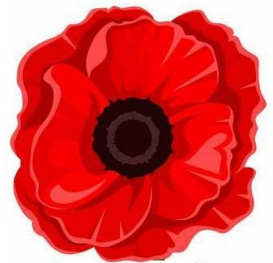
A virág jelkép

Az előtérbe belépve rusztikus kissé kopott, de ránézésre pazarul gazdagon berendezett helyiségbe jutnak a karakterek. Minden berendezési tárgy a helyén van, csak kissé kopott, néhol lepergett a festék. Világítás nincs, csupán néha a villámlás világítja meg néha a bútorokat. Magasabb részeken rózsauveg található így a villámok által megvilágított terem meseszerűnek hat.